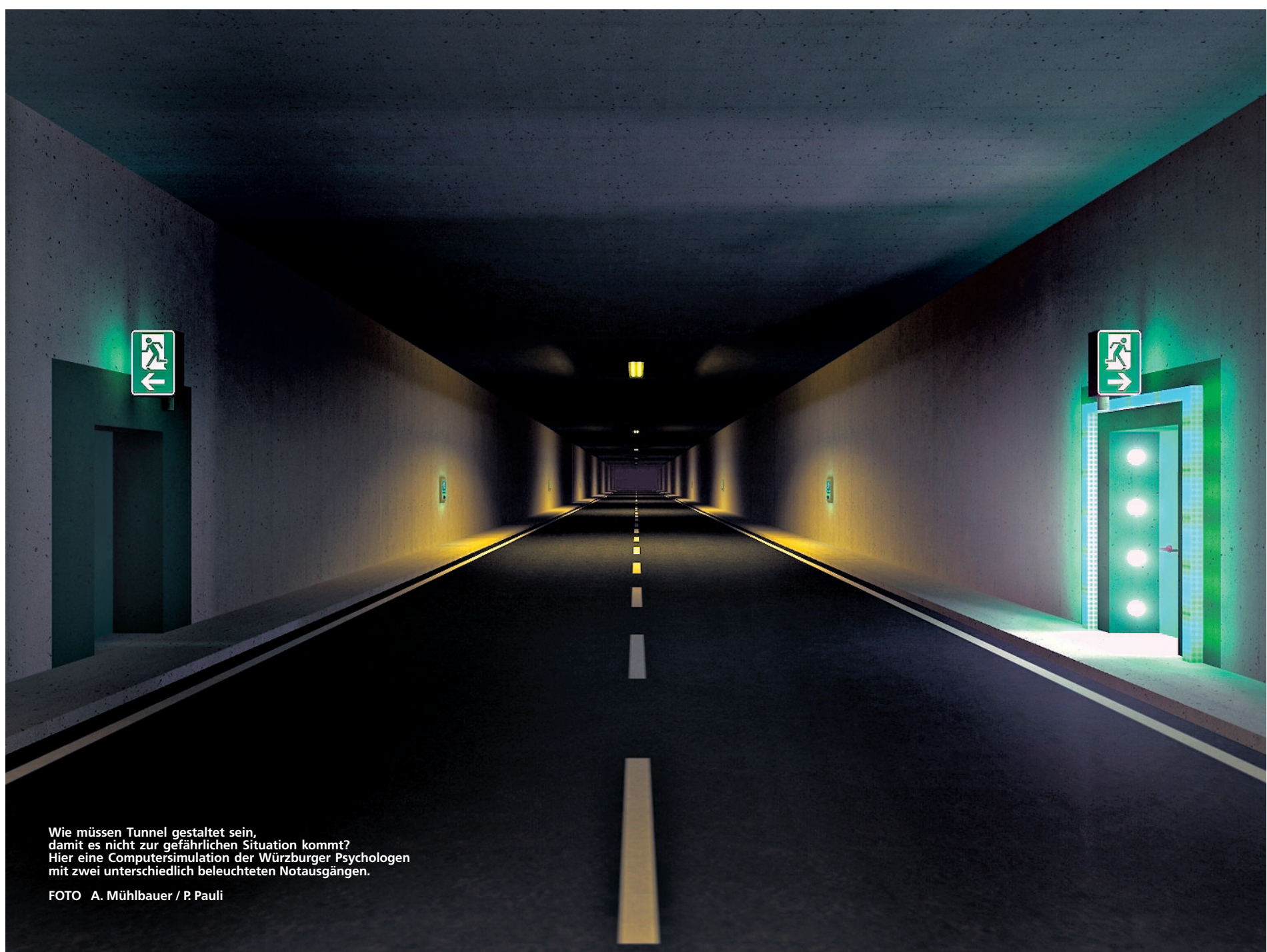
Wie müssen Tunnel gestaltet sein, damit es nicht zur gefährlichen Situation kommt? Hier eine Computersimulation der Würzburger Psychologen mit zwei unterschiedlich beleuchteten Notausgängen.

Feine Partikel, die aus der chinesischen Taklamakan-Wüste ausgeblasen werden, können den Erdball mehr als einmal umrunden, bevor sie sich endgültig wieder absetzen. Für die Reise über mehrere Kontinente und Ozeane benötigen sie nach Beobachtungen von japanischen Forschern 13 Tage. Damit legt der Feinstaub noch größere Distanzen zurück als bekannt: Bislang hatte man das mineralische Material in Eisbohrkernen aus Grönland sowie den französischen Alpen nachgewiesen. Satellitendaten eines Staubaubschubs in der Taklamakan-Wüste zeigten nun, dass die Reise der Aerosole sogar wieder bis nach Ostasien zurück geht.